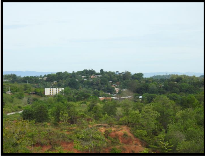
Imagen 1. Panorámica del municipio de Zaragoza

El esquema de conectividad ecosistémica se deriva de un análisis regional del territorio a escala departamental, presentando una red de conectividades ecosistémicas como conjunto de probabilidades de movilidad de la biodiversidad a través de distintas rutas, que pueden o no coincidir con espacios naturales o antrópicos, que soportan el ordenamiento territorial en términos de oferta y demanda de bienes y servicios ecosistémicos para la población.