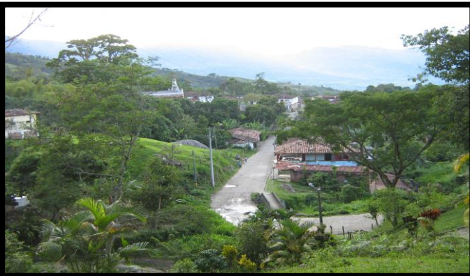
Imagen 1. Panorámicas del municipio de Valparaíso

Este instrumento va a tener coincidencias con los determinantes ambientales definidos en la norma para tal que hacen parte de la estructura ecológica local, por tanto, va a coexistir desde lo espacial en el territorio con suelos con restricciones y condicionamientos a su uso determinado en ordenamiento territorial, se debe entender en términos de gestión para la biodiversidad como insumo en el ordenamiento ambiental territorial y sus servicios ecosistémicos. En este orden de ideas este instrumento diferencia los tipos de restricciones del suelo de acuerdo a los niveles definidos en la Ley 388 de 1997, donde prevalece lo ya tomado como determinante ambiental desde lo local hacia lo regional presentes del medio natural, transformados, gestión del riesgo y cambio climático y relaciones con densidades de ocupación del suelo, comportándose como articulador del territorio y a su vez orientador de los modelos de ocupación territorial propendiendo por la sostenibilidad ambiental.