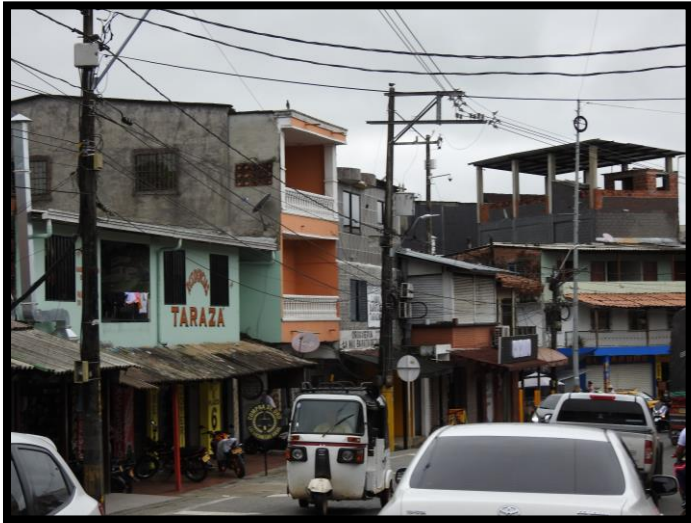
Imagen 1. Panorámica del municipio de Tarazá

El esquema de conectividad ecosistémica se deriva de un análisis regional del territorio a escala departamental, presentando una red de conectividades ecosistémicas como conjunto de probabilidades de movilidad de la biodiversidad a través de distintas rutas, que pueden o no coincidir con espacios naturales o antrópicos, que soportan el ordenamiento territorial en términos de oferta y demanda de bienes y servicios ecosistémicos para la población.