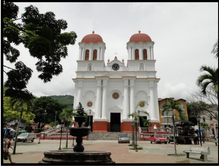
Imagen 1. Panorámicas del municipio de Sopetrán

El esquema de conectividad ecosistémica se deriva de un análisis regional del territorio a escala departamental, presentando una red de conectividades ecosistémicas como conjunto de probabilidades de movilidad de la biodiversidad a través de distintas rutas, que pueden o no coincidir con espacios naturales o antrópicos, que soportan el ordenamiento territorial en términos de oferta y demanda de bienes y servicios ecosistémicos para la población.