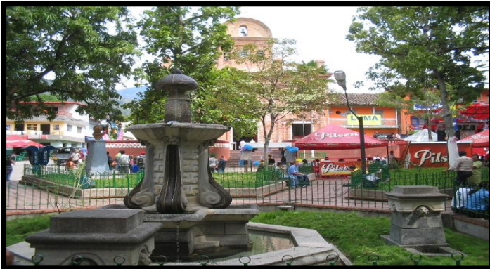
Imagen 1. Panorámica del municipio de San Jerónimo

El esquema de conectividad ecosistémica se deriva de un análisis regional del territorio a escala departamental, presentando una red de conectividades ecosistémicas como conjunto de probabilidades de movilidad de la biodiversidad a través de distintas rutas, que pueden o no coincidir con espacios naturales o antrópicos, que soportan el ordenamiento territorial en términos de oferta y demanda de bienes y servicios ecosistémicos para la población.