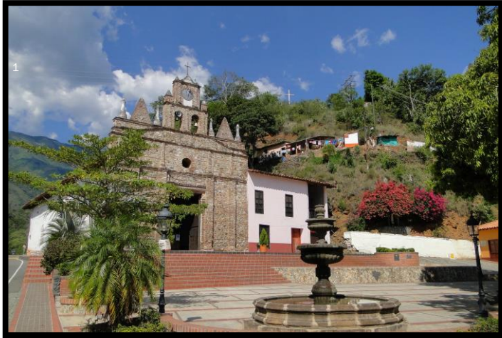
Imagen 1. Panorámica del municipio de Olaya

El esquema de conectividad ecosistémica se deriva de un análisis regional del territorio a escala departamental, presentando una red de conectividades ecosistémicas como conjunto de probabilidades de movilidad de la biodiversidad a través de distintas rutas, que pueden o no coincidir con espacios naturales o antrópicos, que soportan el ordenamiento territorial en términos de oferta y demanda de bienes y servicios ecosistémicos para la población.