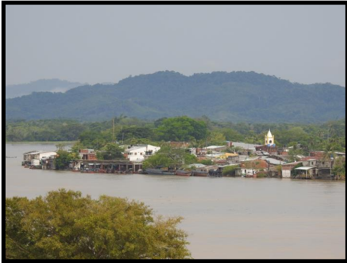
Imagen 1. Panorámica del municipio de Nechí

El esquema de conectividad ecosistémica se deriva de un análisis regional del territorio a escala departamental, presentando una red de conectividades ecosistémicas como conjunto de probabilidades de movilidad de la biodiversidad a través de distintas rutas, que pueden o no coincidir con espacios naturales o antrópicos, que soportan el ordenamiento territorial en términos de oferta y demanda de bienes y servicios ecosistémicos para la población.