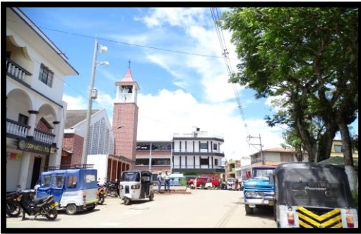
Imagen 1. Panorámica del municipio de Maceo

El esquema de conectividad ecosistémica se deriva de un análisis regional del territorio a escala departamental, presentando una red de conectividades ecosistémicas como conjunto de probabilidades de movilidad de la biodiversidad a través de distintas rutas, que pueden o no coincidir con espacios naturales o antrópicos, que soportan el ordenamiento territorial en términos de oferta y demanda de bienes y servicios ecosistémicos para la población.