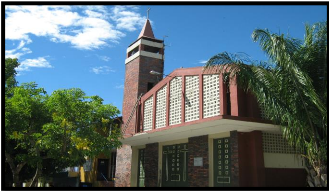
Imagen 1. Panorámica del municipio de La Pintada

El esquema de conectividad ecosistémica se deriva de un análisis regional del territorio a escala departamental, presentando una red de conectividades ecosistémicas como conjunto de probabilidades de movilidad de la biodiversidad a través de distintas rutas, que pueden o no coincidir con espacios naturales o antrópicos, que soportan el ordenamiento territorial en términos de oferta y demanda de bienes y servicios ecosistémicos para la población.