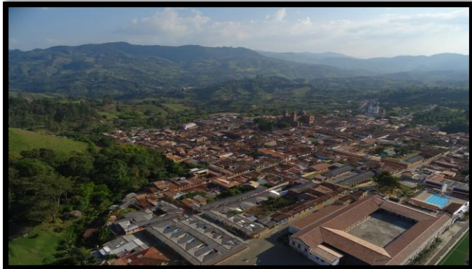
Imagen 1. Panorámica del municipio de Jericó

El esquema de conectividad ecosistémica se deriva de un análisis regional del territorio a escala departamental, presentando una red de conectividades ecosistémicas como conjunto de probabilidades de movilidad de la biodiversidad a través de distintas rutas, que pueden o no coincidir con espacios naturales o antrópicos, que soportan el ordenamiento territorial en términos de oferta y demanda de bienes y servicios ecosistémicos para la población.