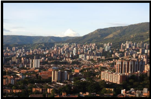
Imagen 1. Panorámicas del municipio de Envigado

El esquema de conectividad ecosistémica se deriva de un análisis regional del territorio a escala departamental, presentando una red de conectividades ecosistémicas como conjunto de probabilidades de movilidad de la biodiversidad a través de distintas rutas, que pueden o no coincidir con espacios naturales o antrópicos, que soportan el ordenamiento territorial en términos de oferta y demanda de bienes y servicios ecosistémicos para la población.