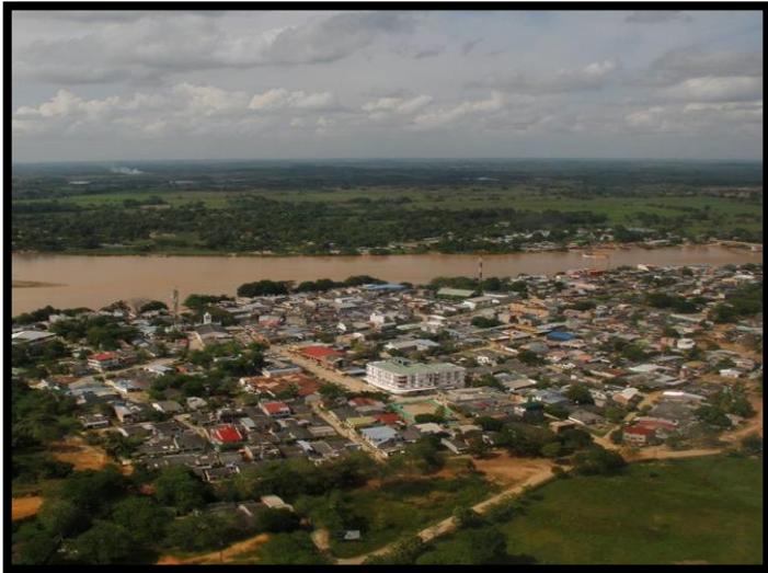
Imagen 1. Panorámica del municipio de El Bagre

El esquema de conectividad ecosistémica se deriva de un análisis regional del territorio a escala departamental, presentando una red de conectividades ecosistémicas como conjunto de probabilidades de movilidad de la biodiversidad a través de distintas rutas, que pueden o no coincidir con espacios naturales o antrópicos, que soportan el ordenamiento territorial en términos de oferta y demanda de bienes y servicios ecosistémicos para la población.