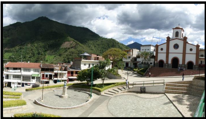
Imagen 1. Panorámica del municipio de Caicedo

El esquema de conectividad ecosistémica se deriva de un análisis regional del territorio a escala departamental, presentando una red de conectividades ecosistémicas como conjunto de probabilidades de movilidad de la biodiversidad a través de distintas rutas, que pueden o no coincidir con espacios naturales o antrópicos, que soportan el ordenamiento territorial en términos de oferta y demanda de bienes y servicios ecosistémicos para la población.