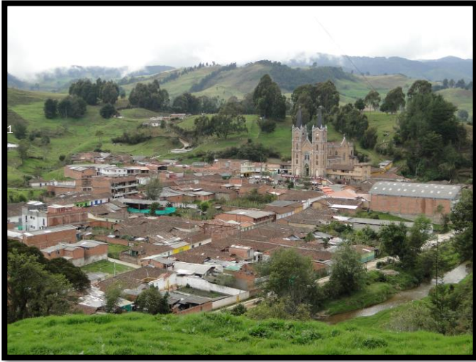
Imagen 1. Panorámica del municipio de Belmira

El esquema de conectividad ecosistémica se deriva de un análisis regional del territorio a escala departamental, presentando una red de conectividades ecosistémicas como conjunto de probabilidades de movilidad de la biodiversidad a través de distintas rutas, que pueden o no coincidir con espacios naturales o antrópicos, que soportan el ordenamiento territorial en términos de oferta y demanda de bienes y servicios ecosistémicos para la población.