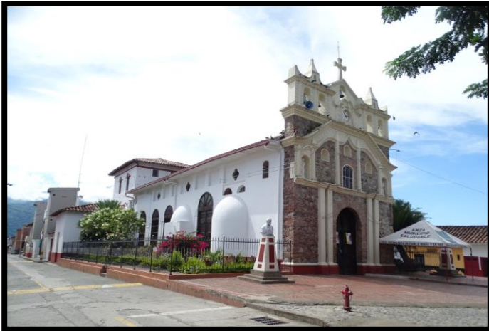
Imagen 1. Panorámica del municipio de Anzá

Este instrumento va a tener coincidencias con los determinantes ambientales definidos en la norma para tal que hacen parte de la estructura ecológica local, por tanto, va a coexistir desde lo espacial en el territorio con suelos con restricciones y condicionamientos a su uso determinado en ordenamiento territorial, se debe entender en términos de gestión para la biodiversidad como insumo en el ordenamiento ambiental territorial y sus servicios ecosistémicos. En este orden de ideas este instrumento diferencia los tipos de restricciones del suelo de acuerdo a los niveles definidos en la Ley 388 de 1997, donde prevalece lo ya tomado como determinante ambiental desde lo local hacia lo regional presentes del medio natural, transformados, gestión del riesgo y cambio climático y relaciones con densidades de ocupación del suelo, comportándose como articulador del territorio y a su vez orientador de los modelos de ocupación territorial propendiendo por la sostenibilidad ambiental.