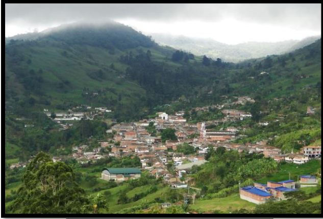
Imagen 1. Panorámica del municipio de Angostura

Este instrumento va a tener coincidencias con los determinantes ambientales definidos en la norma para tal que hacen parte de la estructura ecológica local, por tanto, va a coexistir desde lo espacial en el territorio con suelos con restricciones y condicionamientos a su uso determinado en ordenamiento territorial, se debe entender en términos de gestión para la biodiversidad como insumo en el ordenamiento ambiental territorial y sus servicios ecosistémicos. En este orden de ideas este instrumento diferencia los tipos de restricciones del suelo de acuerdo a los niveles definidos en la Ley 388 de 1997, donde prevalece lo ya tomado como determinante ambiental desde lo local hacia lo regional presentes del medio natural, transformados, gestión del riesgo y cambio climático y relaciones con densidades de ocupación del suelo, comportándose como articulador del territorio y a su vez orientador de los modelos de ocupación territorial propendiendo por la sostenibilidad ambiental.