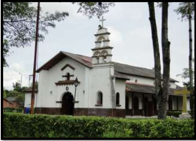
Imagen 1. Panorámica del municipio de Yondó

El esquema de conectividad ecosistémica se deriva de un análisis regional del territorio a escala departamental, presentando una red de conectividades ecosistémicas como conjunto de probabilidades de movilidad de la biodiversidad a través de distintas rutas, que pueden o no coincidir con espacios naturales o antrópicos, que soportan el ordenamiento territorial en términos de oferta y demanda de bienes y servicios ecosistémicos para la población.