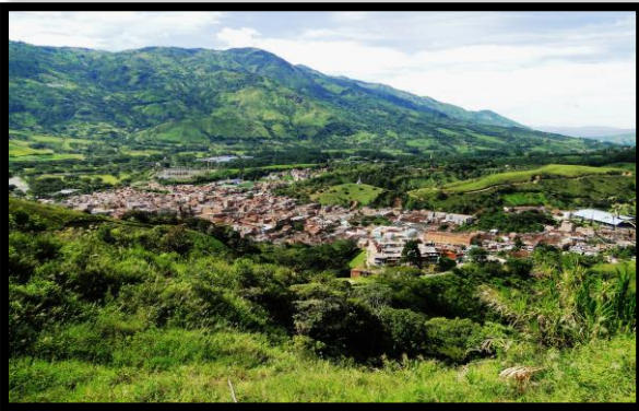
Imagen 1. Panorámicas del municipio de Barbosa

El esquema de conectividad ecosistémica se deriva de un análisis regional del territorio a escala departamental, presentando una red de conectividades ecosistémicas como conjunto de probabilidades de movilidad de la biodiversidad a través de distintas rutas, que pueden o no coincidir con espacios naturales o antrópicos, que soportan el ordenamiento territorial en términos de oferta y demanda de bienes y servicios ecosistémicos para la población.