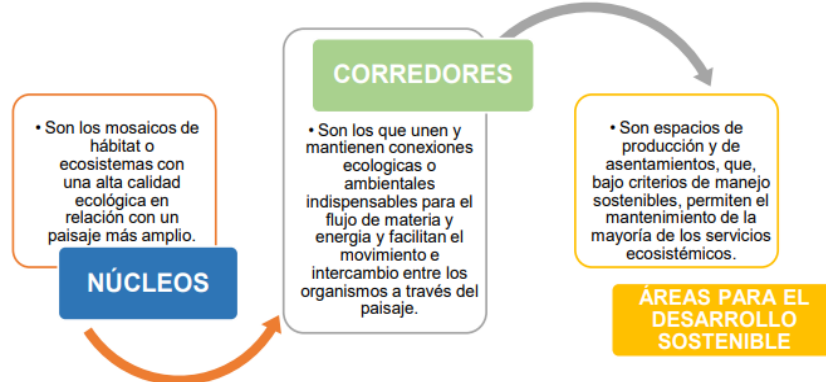
Ilustración 9. Esquema de la estructura ecológica principal