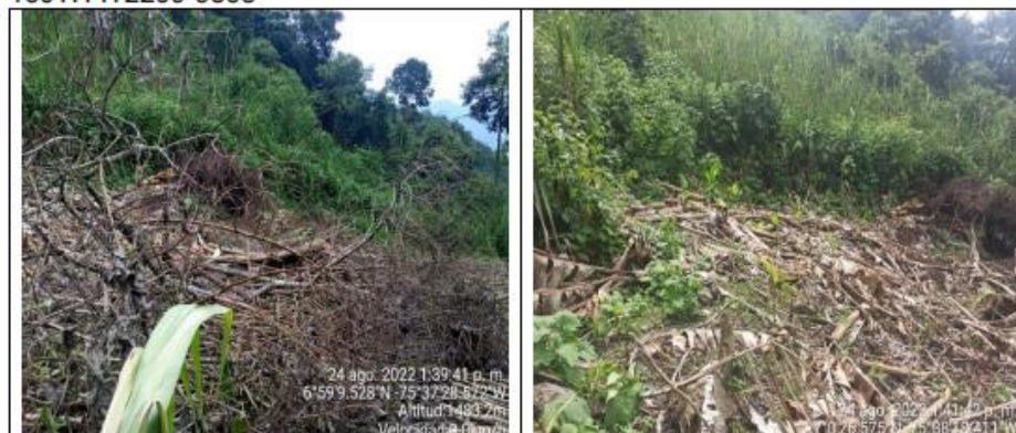
Fotografías 1 a 6. Evidencia de las actividades de tala y socola sobre una zona de afloramiento de agua de la cual se surten los habitantes de la vereda Media Loma.

Corantioquia está comprometida con el tratamiento legal, lícito, confidencial y seguro de sus datos personales. Por favor consulte nuestra Política de Tratamiento de datos personales en nuestra página web: www.corantioquia.gov.co