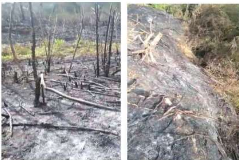
Fotografías 1 y 2. Fragmentos de la evidencia aportada por el quejoso respecto a las quemas efectuadas en zona de nacimiento en la vereda La Estrella del municipio de Yarumal.

cuerpos de agua que discurren por el predio, estas masas boscosas tienen estructura vertical y horizontal definida en algunos tramos con presencia de ejemplares en todos los estados sucesionales y especies valiosas para la prestación de servicios ecosistémicos como: espadero ( Myrsine coriácea ), chagualo ( Clusia multiflora ), encenillo ( Weinmannia pubescens ), carate ( Vismia ferruginea ), entre otras. En otros sectores la vegetación asociada al curso de agua es poco densa y en general no se guardan los retiros obligatorios según lo dispuesto en la ley. De acuerdo con el reporte allegado a la Corporación se realizaron quemas en zonas aledañas a un nacimiento de agua del que se abastecen varias familias y se ha ocasionado disminución en la disponibilidad del recurso aguas abajo. La intervención con quema obedecería a intereses de expansión de la frontera agrícola del predio y en el área despejada se habrían establecido ya algunos cultivos de pancoger; se aportó además material audiovisual como evidencia de la denuncia mencionada (Ver fotografías 1 y 2).