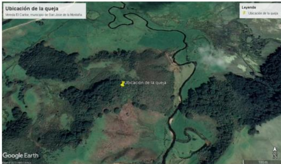
Imagen 1. Ubicación del lugar de la queja.

En atención a la solicitud del usuario, el día 20 de octubre del año 2023, se realizó visita técnica de control y seguimiento -queja al sitio conocido como el río en la vereda Vega del Río, en las coordenadas 6°47'49" N -75°39'24" W cota 2699, zona rural del municipio de San José de la Montaña.