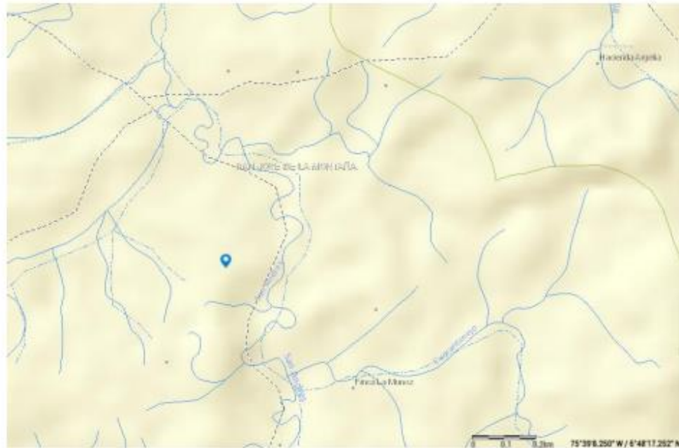
Imagen 2. Identificación de fuente hídrica.