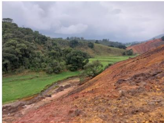
Foto 2. Cuerpo de agua sin barreras de protección

A consecuencia de dichas actividades, se observa que hay un movimiento de tierras que deja descubierto el suelo y este a su vez esta siendo arrastrado con las lluvias hacia el cauce del río. Adicionalmente se evidencia que el cuerpo de agua no cuenta con alguna barrera de contención del sedimento lo que posiblemente este ocasionando colmatación del río.