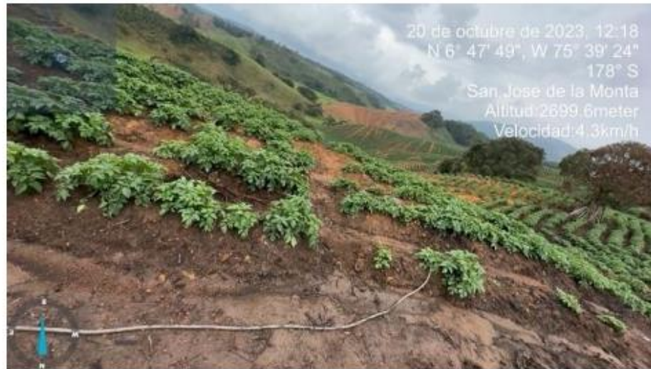
Foto 3. establecimiento de cultivo de papa.