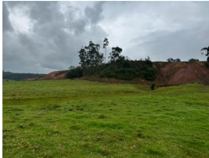
Foto 1. Predio donde se interpuso la queja.

A consecuencia de dichas actividades, se observa que hay un movimiento de tierras que deja descubierto el suelo y este a su vez esta siendo arrastrado con las lluvias hacia el cauce del río. Adicionalmente se evidencia que el cuerpo de agua no cuenta con alguna barrera de contención del sedimento lo que posiblemente este ocasionando colmatación del río.