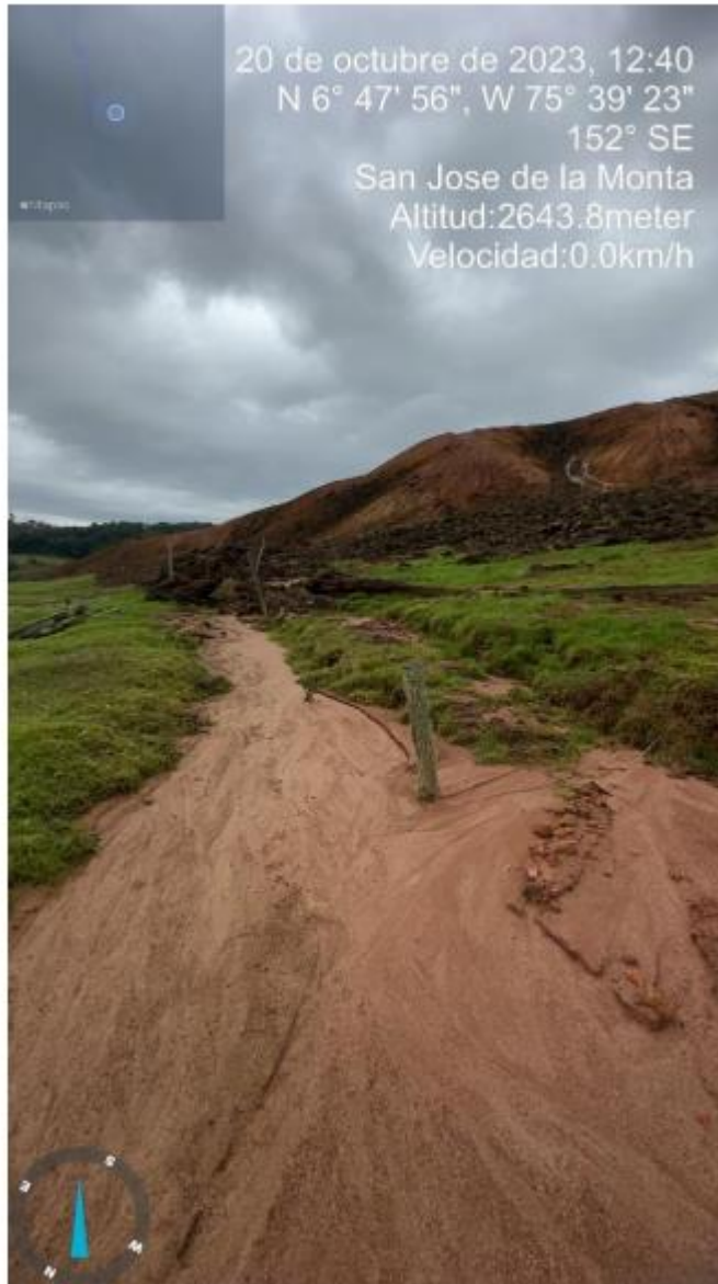
Foto 4.proceso de erosión cerca fuente hídrica.

Es importante mencionar que el lugar no cuenta con un cercado aledaño a la fuente hídrica, además se evidencia proceso de erosión en las zonas de retiro.