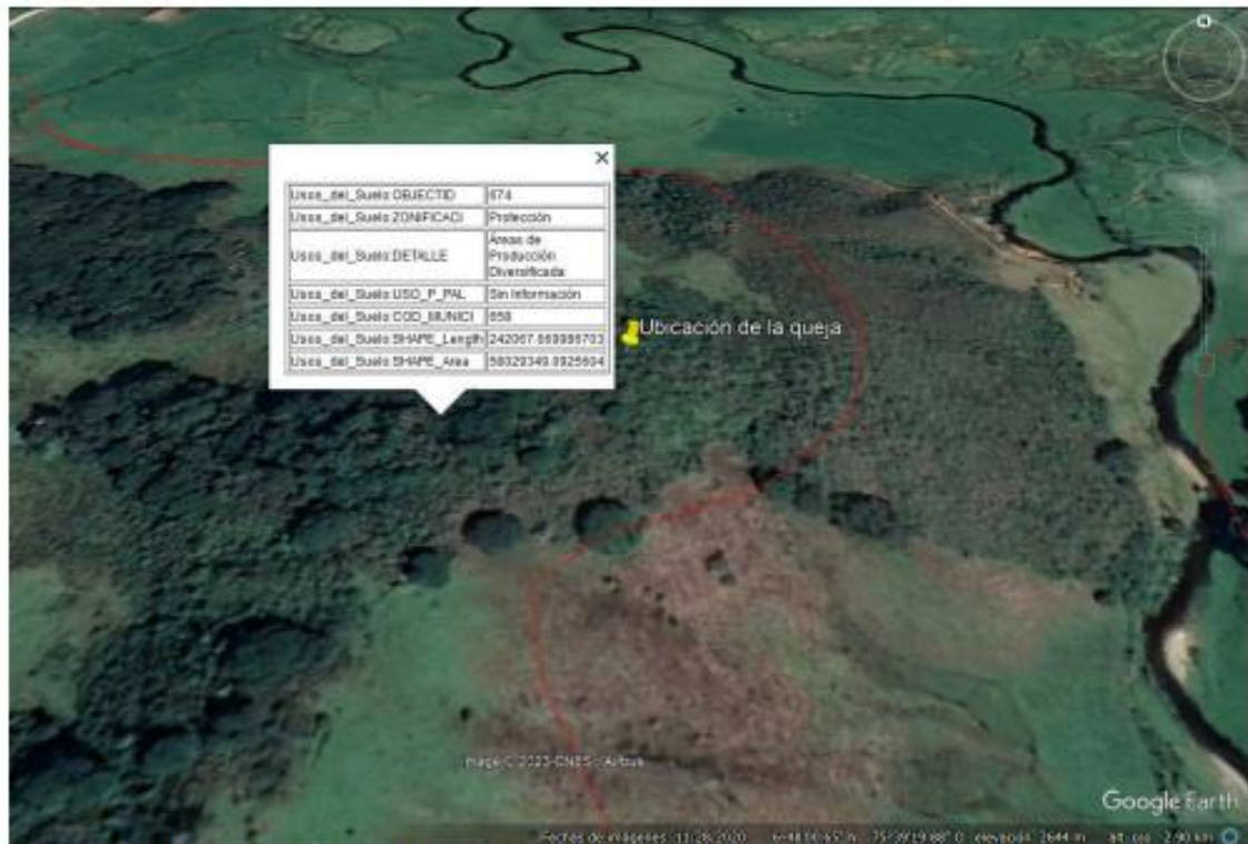
Imagen 4. Usos del suelo para el municipio de San Jose de la Montaña.

4. Análisis de documentación aportada N/A