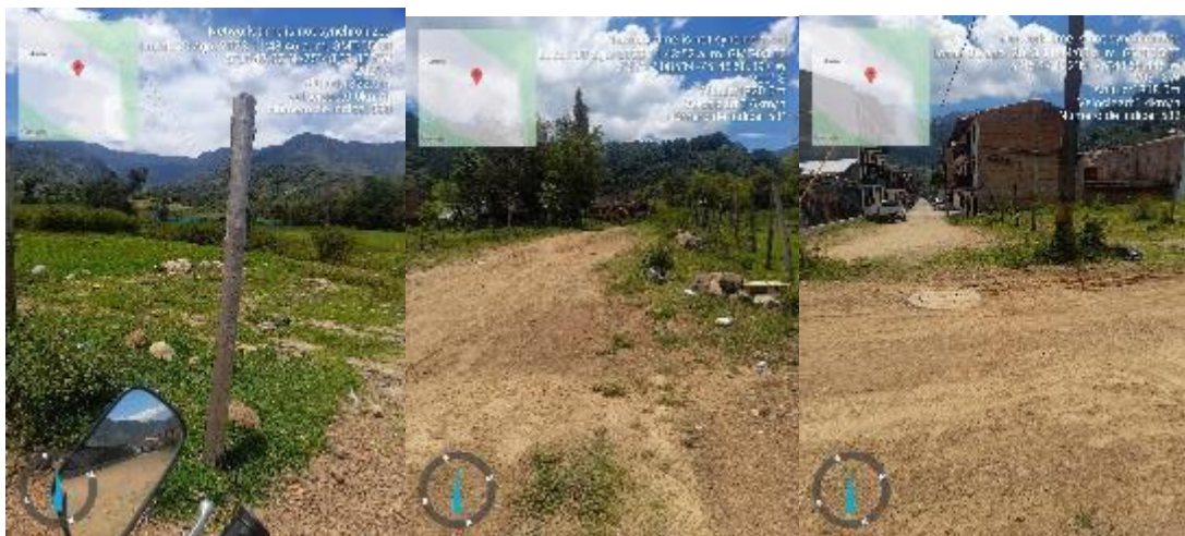
Imagen No. 1, 2 y Obra aperturada inicio de la carrera sexta.