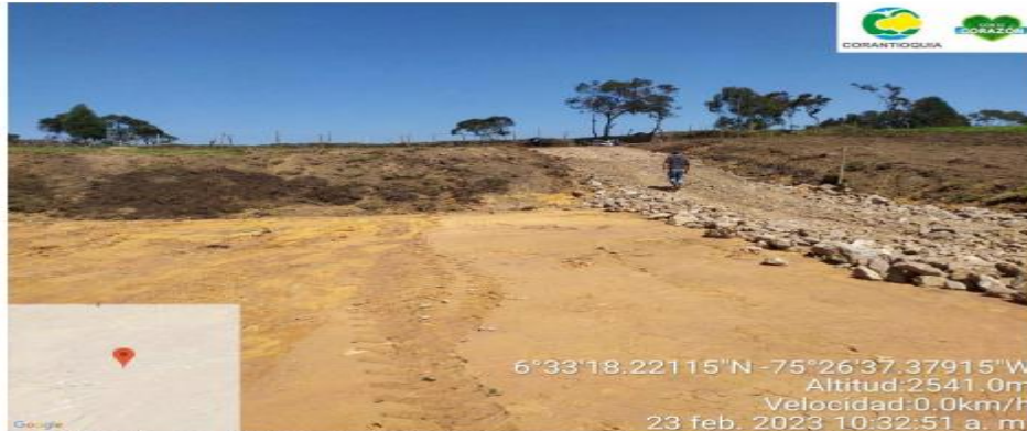
Fotografía 1. Lugar del movimiento de tierra para la construcción de la sala de ordeño

Para dar continuidad a la visita y verificar las condiciones de la fuente hídrica, fue necesario visitar cada una de las captaciones de la fuente abastecedora con fin de verificar las condiciones organolépticas.